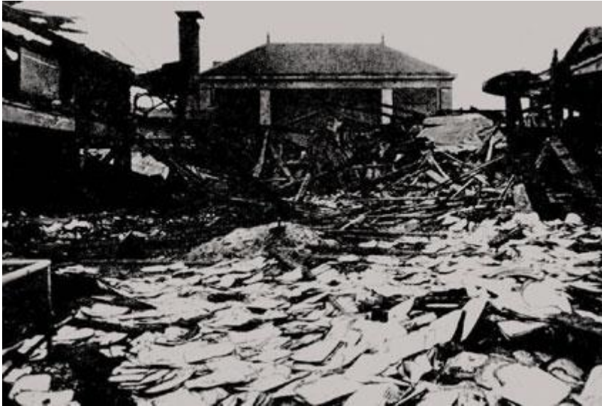
Het bevolkingsregister Amsterdam. Verwoest na een aanslag van het verzet..