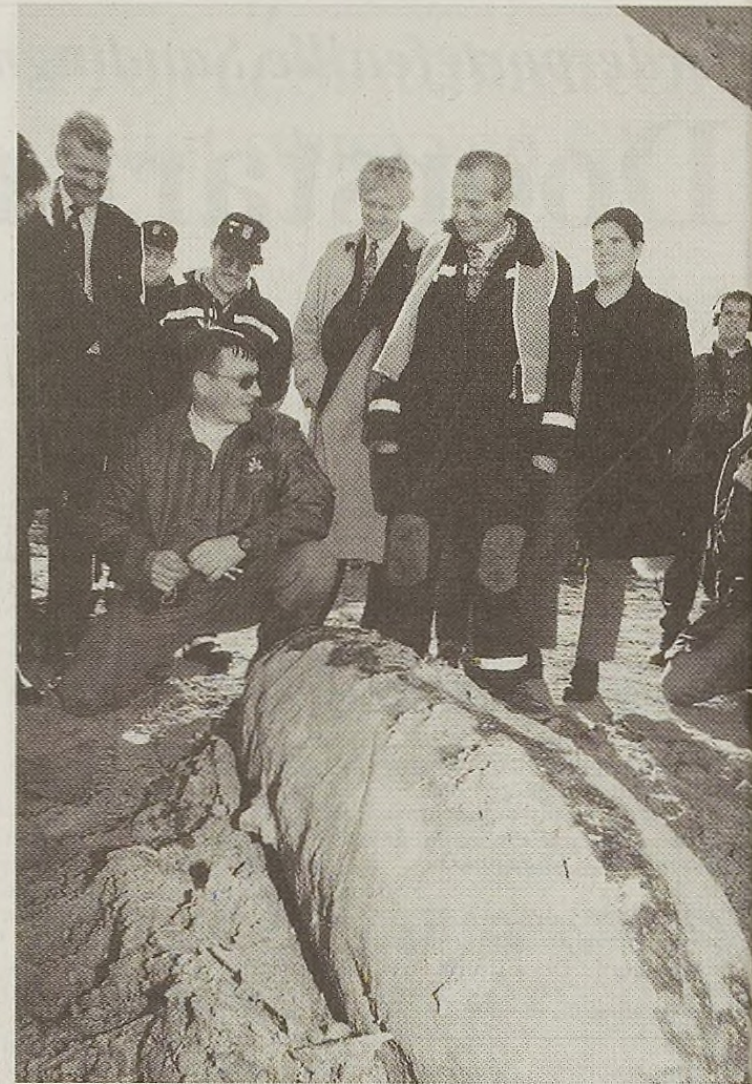
Een van de zes vliegtuigbommen.

ken.” Hij acht de kans zeer groot dat de EOD binnenkort weer bommen moet gaan ruimen. „We hebben luchtfoto's bekeken. En die hebben ons duidelijk gemaakt dat het kwadrant dat nu aan bod komt, het meest is bestookt tijdens die luchtaanvallen van oktober 1944.”