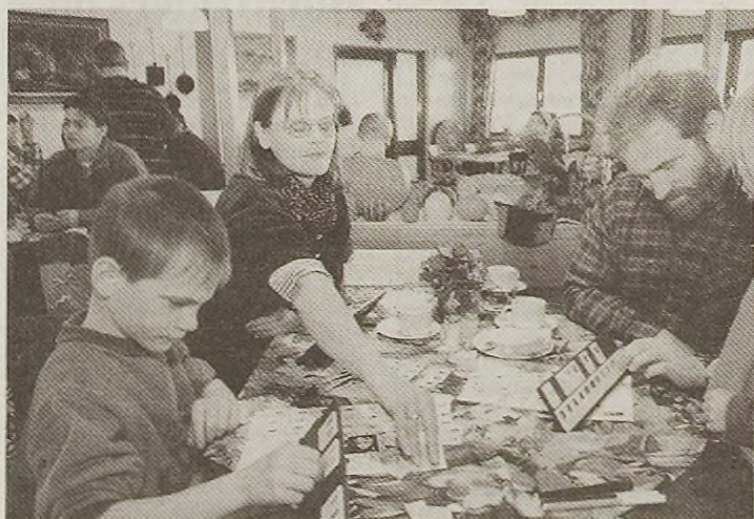
Met Rummikub, puzzels, kranten en tijdschriften kwamen de evacués de dag door.