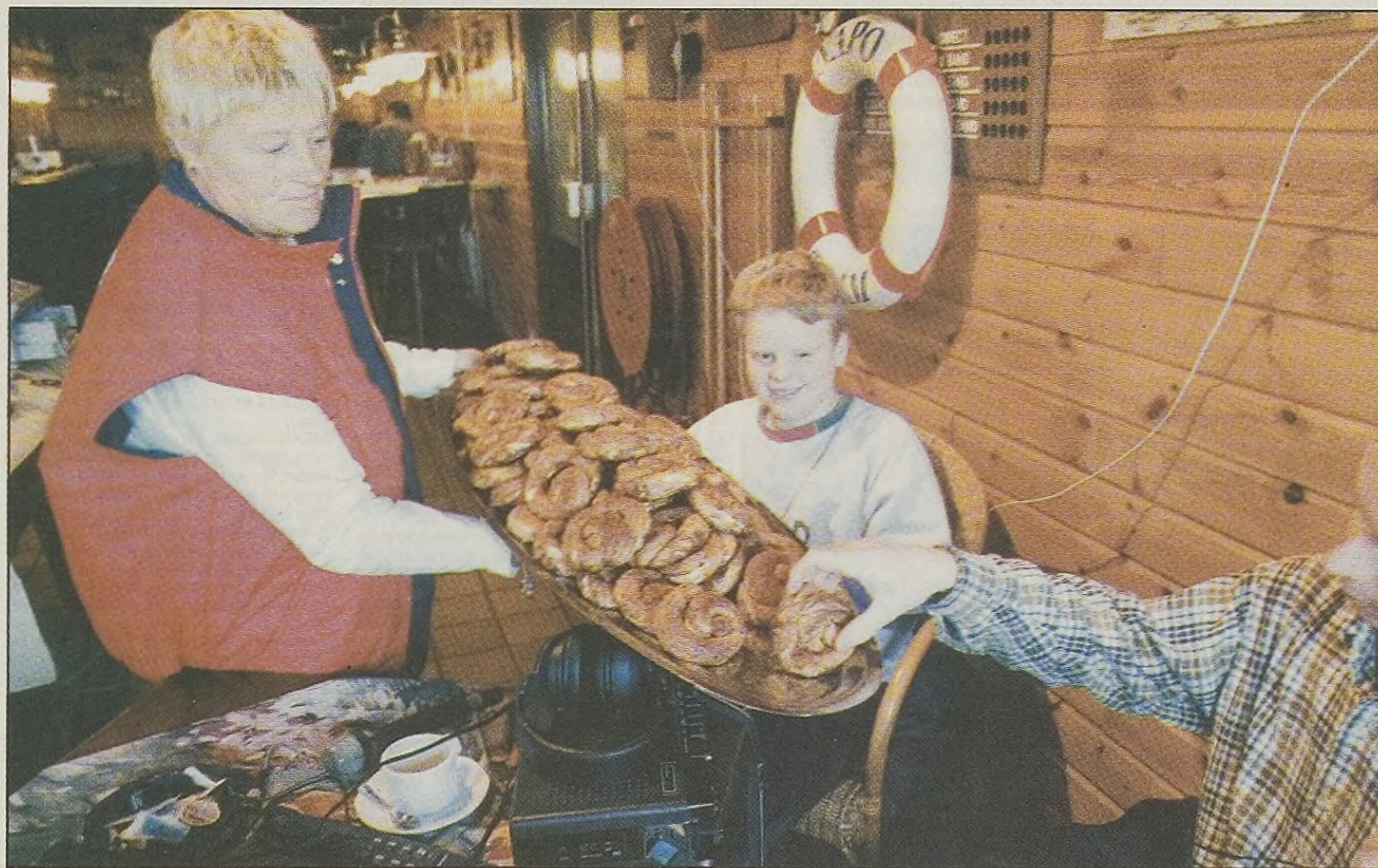
Het verblijf op camping Napoleonhoeve wordt onder meer met Zeeuwse bolussen draaglijk gemaakt.