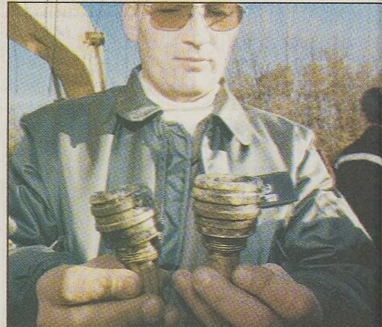
Twee van de slaghoedjes van de bommen.