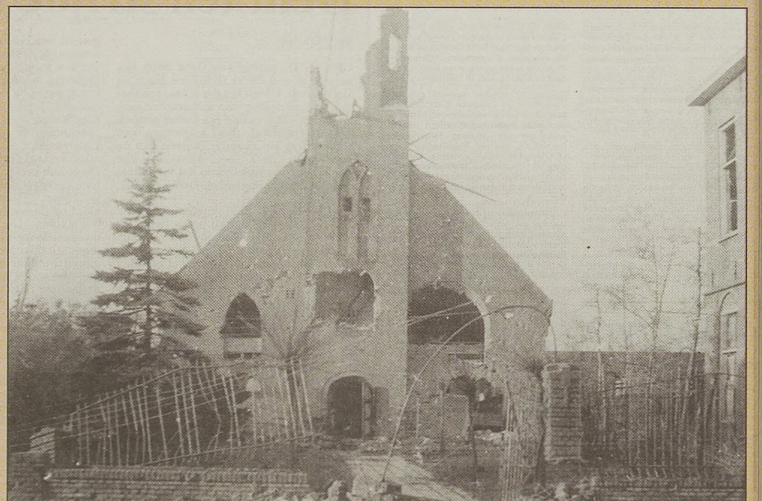
De Nederlands-Hervormde Kerk was een van de vele gebouwen die werden vernield.

Bij de bombardementen van Breskens verloren ongeveer tweehonderd mensen het leven.