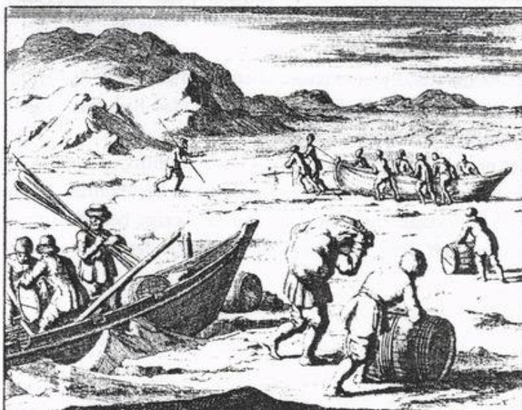
Afbeelding behorend bij dezelfde serie van vier prenten over de overwintering op Nova Zembla (blz. 169). Van dezelfde Jan Luiken komen meerdere versies voor van dezelfde taferelen.

In een van onze komende nummers komen wij terug op het bewogen leven van Pieter Bezemer.