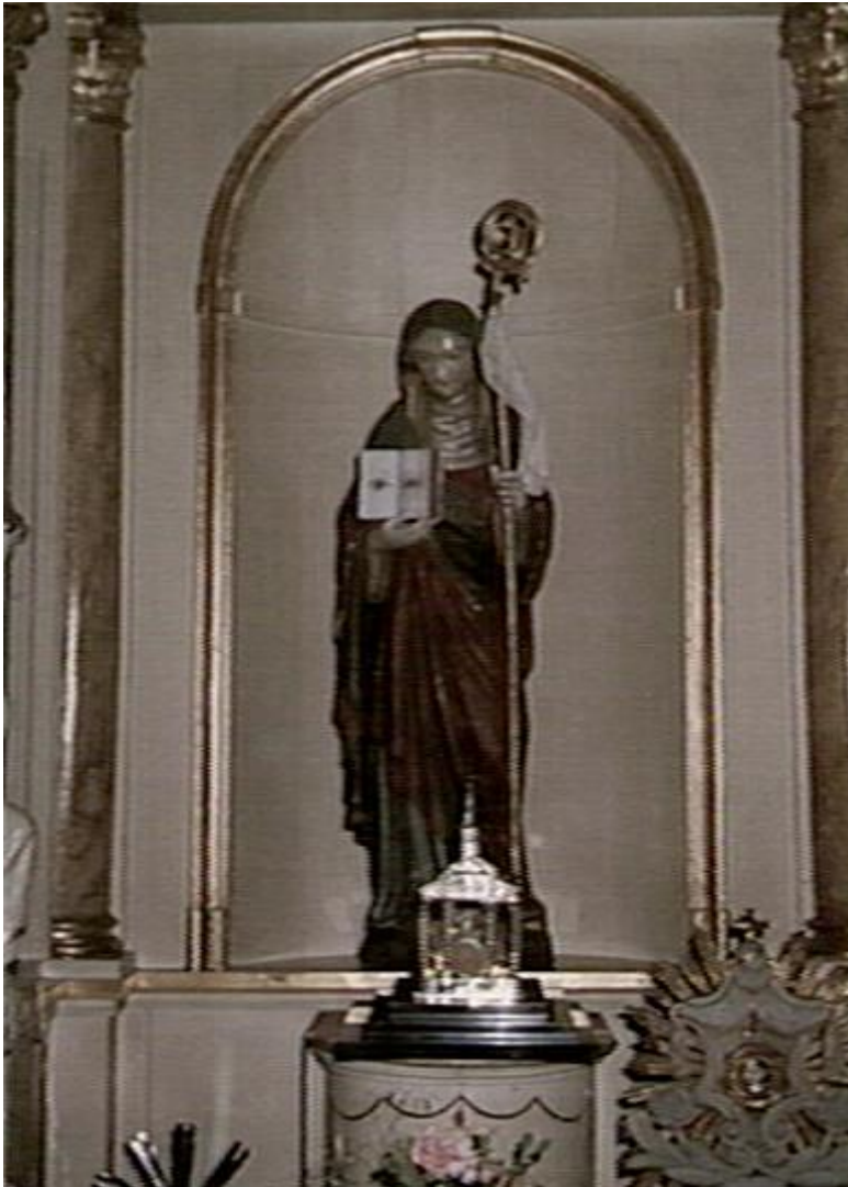
Beeld St. Odilia Patrones Visueel gehandicapten (heilige voor de blinden) Waar de Rooms-Katholieke Blindenbond St. Odilia naar vernoemd is.

Er waren drie blindenbonden: de Nederlandse Blindenbond (NBB), de Rooms-Katholieke Blindenbond St. Odilia en de Nederlandse Christelijke blindenbond (NCB). Naar schatting had de NBB ca. 650, St. Odilia ca. 350 en de NCB ca. 120 leden. Het totaal aantal blinden in ons land werd destijds geschat op 4.000; mensen die van jongs af blind waren of dat later waren geworden.